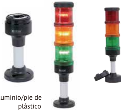
Aluminio/pie de plástico

Columnas de señalización modular, para todo tipo de aplicaciones Columnas de señalización de nuevo diseño basadas en la tecnología LED Excelente relación calidad precio Completa gama de módulos LED de alta potencia con las siguientes funciones - LED luz fija - LED luz intermitente - LED luz estroboscópica (un destello) - LED luz estroboscópica (multi destello) Módulos LED luz fija/luz estroboscópica y multi destello en versión "ALTO RENDIMIENTO" Larga vida útil, libre de mantenimiento, gracias a la tecnología LED Módulos zumbadores y sirenas multitonos Conexión de fácil acceso Amplia gama de opciones de montaje incluyendo sistemas de montaje rápido Apropiado para PLC (bajo consumo) Elevada protección IP 66 certificadas UL tipo 4/4X/13